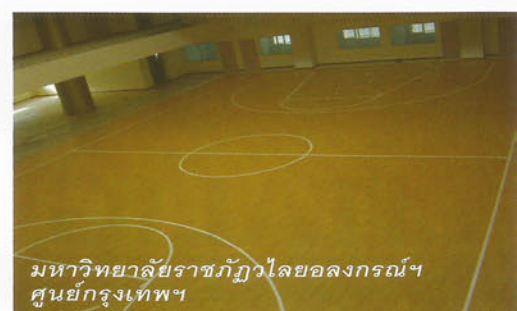
มหาวิทยาลัยราชภัฏวไลยอลงกรณ์ฯ ศูนย์กรุงเทพฯ