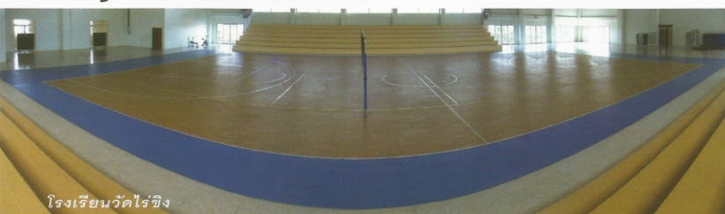
โรงเรียนวัดไร่ขิง